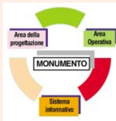
Fig. 3 Articolazione del sistema organizzativo di manutenzione

È necessario, quindi, per il patrimonio storico-architettonico l'integrazione della concezione di "lavoro-intervento con quella più ampia di sistema" 25 il che implica di considerare in modo integrato non solo le attività strettamente esecutive di intervento, ma quelle informative, programmatiche, organizzative, ispettive, diagno-